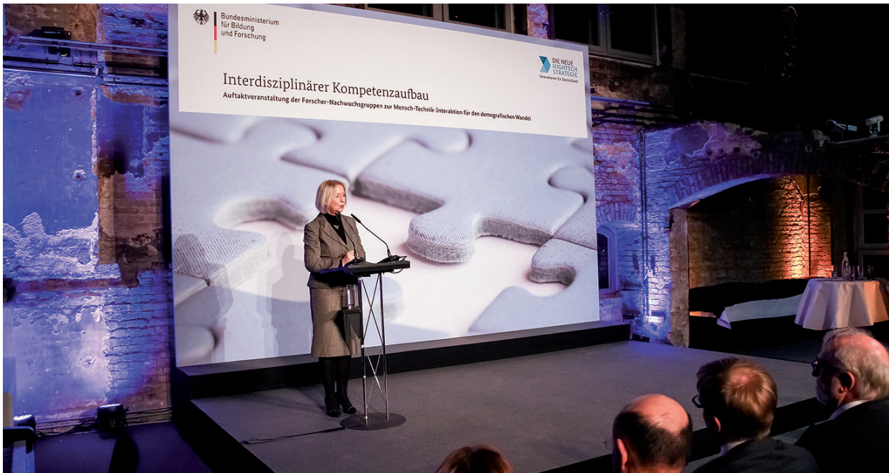
Bundesforschungsministerin Prof. Dr. Wanka eröffnete die Auftaktveranstaltung in der Hörsaalruine der Charité.

am 15. Januar 2015 in der Hörsaalruine der Charité, Berlin